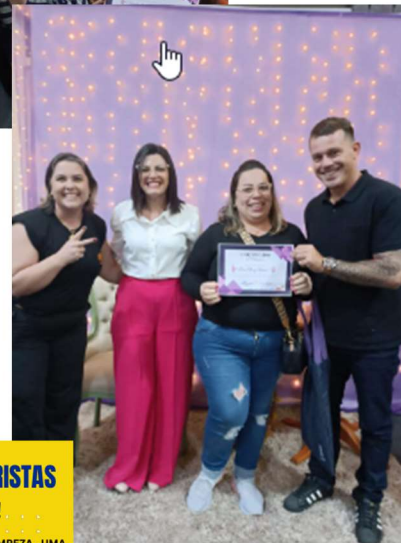
Whorkshop de Diaristas – Capacitação de Diaristas em Empreendedorismo realizado pela Sala do Empreendedor em 30/08/2023